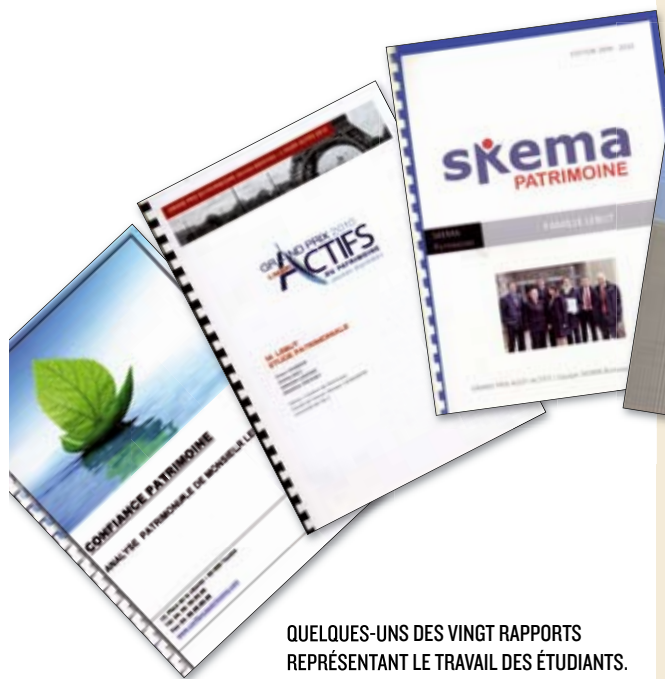
QUELQUES-UNS DES VINGT RAPPORTS REPRÉSENTANT LE TRAVAIL DES ÉTUDIANTS.

CE CAS PRATIQUE A ÉTÉ RÉDIGÉ PAR UN EXPERT DE BNP PARIBAS BANQUE PRIVÉE